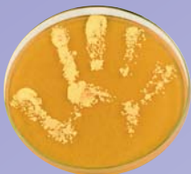
Handabklatsch ohne Seifenwaschung oder Desinfektion

Mit ihrer „Clean Care is Safer Care“-Initiative startete die WHO 2005 eine weltweite Kampagne für mehr Patientensicherheit. Im Mittelpunkt steht die Verbesserung der Händedesinfektion, da diese einen direkten Einfluss auf die Übertragung pathogener Erreger hat. Für dieses Ziel wurde das Konzept der „5 Momente der Händedesinfektion“ entwickelt (1).