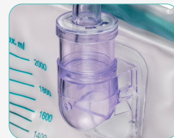
Tropfkammer mit integriertem Anti-Rückflussventil und hydrophob beschichtetem Microfilter