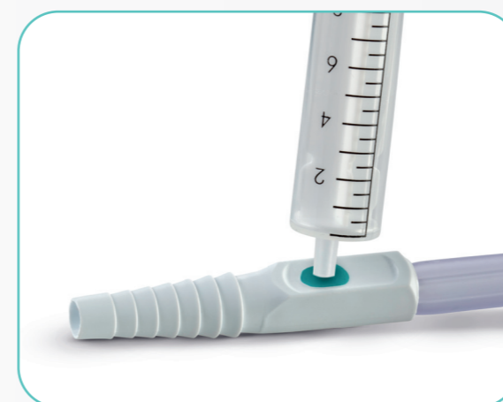
Konnector mit nadelfreier Urinprobe-Entnahmestelle verhindert Stichverletzungen