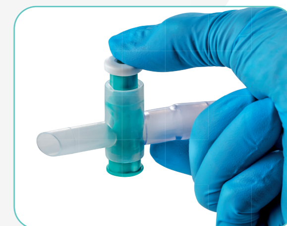
Urin-Ablass mit Kreuzventil für eine hygienische, komfortable Einhandbedienung